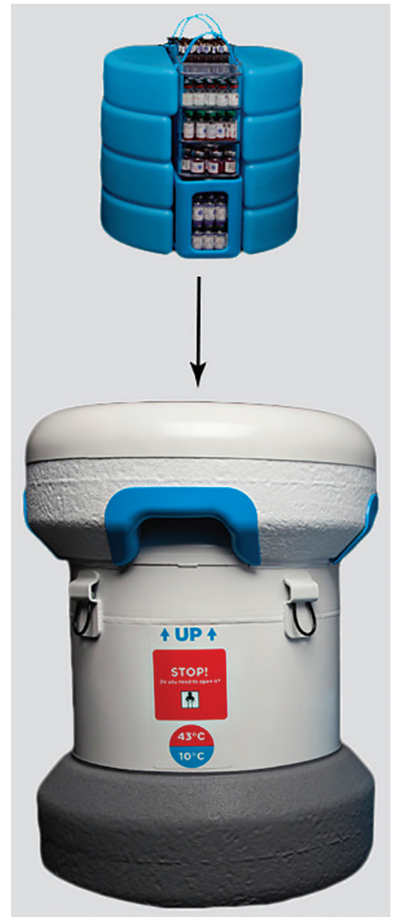
图 2：上：装入物品之后不久的 PVSD 的热仿真；融化冰块的过程通过 COMSOL Multiphysics 中的相变功能进行建模。下：PVSD 使用类似于低温杜瓦瓶的温度控制储存方法。每次只需放入一批冰块，它就可以长时间地储存疫苗。